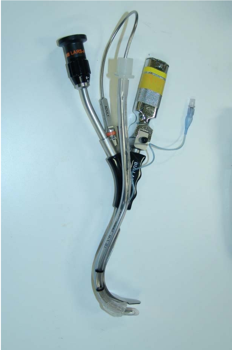
図 1 ブレード型喉頭鏡

独特の彎曲を持ち、アイピースで先端の様子を観察できる。付属スタイレットはブレードの彎曲に合わせてデザインされ、チューブをこれに沿って進めることができる。