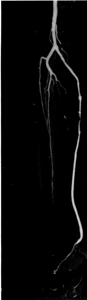
図2 術後10年を経過した静脈グラフトに発生した graft sclerosis によるグラフト狭窄 矢印は吻合部、矢頭は狭窄部を示す。狭窄部切除・置換の際の術中所見で、粥腫による狭窄を認めた。

と言えるだろう(表3)。今後 distal bypass が長期開存成績のさらなる飛躍的向上を獲得できるかどうかは、閉塞原因のうち最もインパクトが強い進行性内膜肥厚の解決に成功するかどうかにかかっていると看做しても過言ではない。