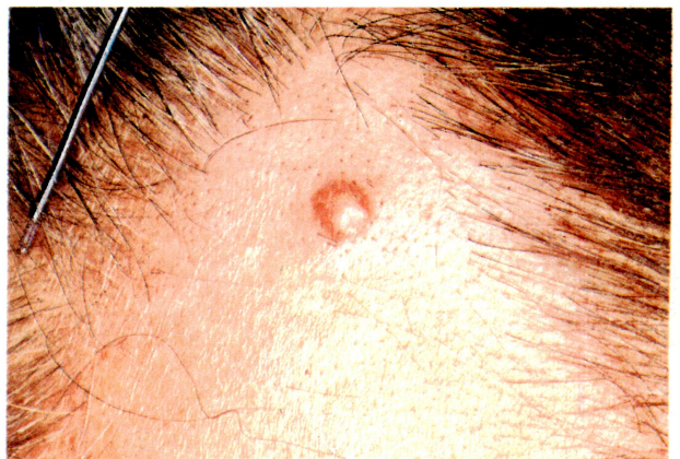
第1図 左前側頭部の小腫瘤

左前側頭部の腫瘤を全摘した。H-E染色では腫瘤部の表皮は菲薄化し，その直下から真皮全層にわたって境界比較的鮮明な稠密な細胞浸潤巣が存在する(第2図)。浸潤細胞は組織球，泡沫細胞，リンパ球，Touton型ならびに異物型巨細胞で，好酸球，毛細血管の増殖および拡張はほとんどみられなかった(第3図)。Sudan III染色で，泡沫細胞内に橙赤色に染まる顆粒状の脂肪滴を認めた。PAS染色では，巨細胞内に細顆粒状のジアスタ